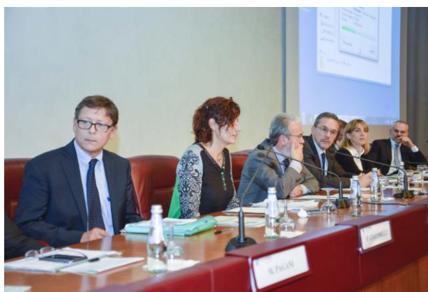
"FORUM RAEE 2013" Il Tavolo dei Relatori