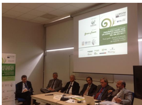
Palermo 6 e 7 giugno 2013 Museo Storico dei Motori e dei Meccanismi Università degli Studi di Palermo – Dipartimento di Ingegneria