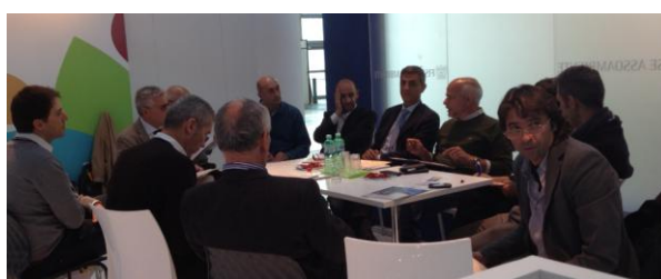
Assemblea ANPAR - Stand FISE Unire