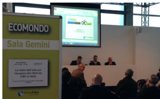
Convegno ANPAR – Rimini (Sala Gemini)

Obiettivo specifico dell'iniziativa è stato, quindi, da una parte, fare il punto della situazione sulle quantità di rifiuti prodotti, riciclati e reimmessi nel ciclo delle costruzioni e dall'altra di presentare una proposta operativa per favorire la collaborazione tra Pubblico e Privato finalizzata all'implementazione di un sistema di recupero efficace ed efficiente e soprattutto in grado di garantire l'utilizzatore sulla qualità dei materiali recuperati.