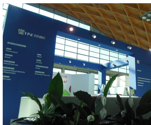
Stand FISE Unire e FISE Assoambiente

Dal punto di vista funzionale la divisione degli spazi ha offerto la possibilità di garantire una buona gestione delle diverse iniziative che si sono svolte, anche contemporaneamente, in fiera.