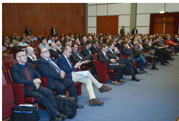
"FORUM RAEE 2013" 218 Ospiti accreditati

Recepimento della Direttiva RAEE: il Sistema italiano si confronta con i nuovi target (Rimini, 8 novembre - Sala Neri 1)