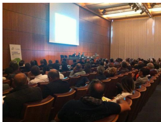
Convegno ADA – ASSODEM - Rimini, 7 novembre (Sala Neri 2)