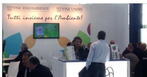
Riunioni con le Aziende - Stand FISE Unire